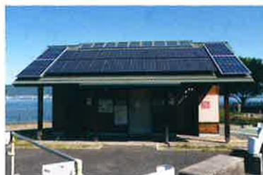
滋賀県 草津市(湖岸緑地公園/トイレ)