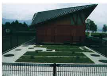
滋賀県 草津市(湖岸緑地公園/トイレ)