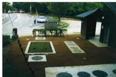
大阪府 池田市五月山公園(登山者用トイレ)