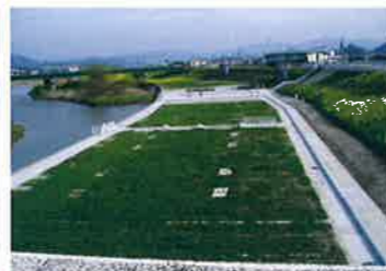
福岡県 飯塚市熊添川(河川浄化)