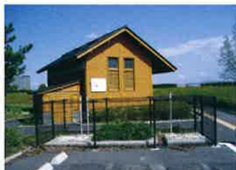
滋賀県 守山市(湖岸緑地公園/トイレ)