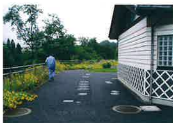
埼玉県 道のオアシス神泉(休憩施設/トイレ)