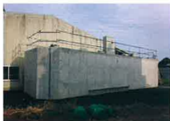
大阪府 クリーニング工場(排水リサイクル)