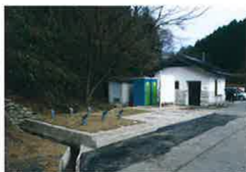
兵庫県 竹田城(駐車場/トイレ)